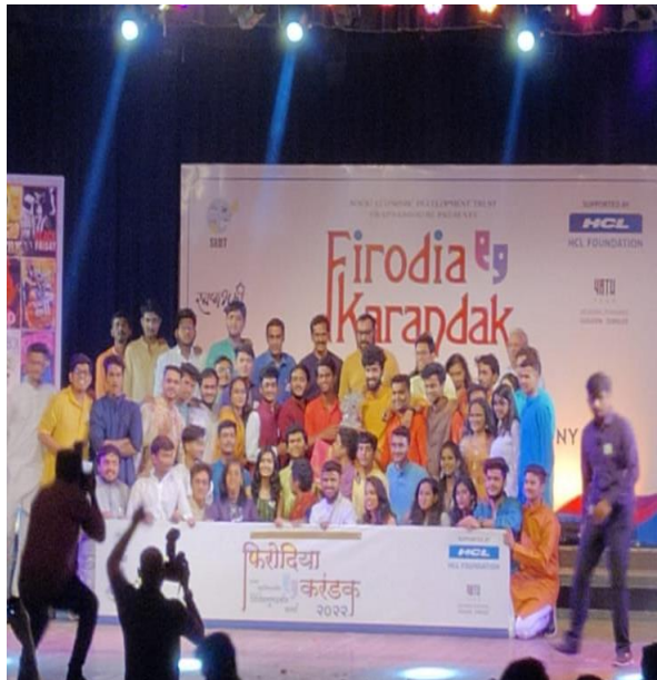
Winning Trophy - VIIT Consolation Prize